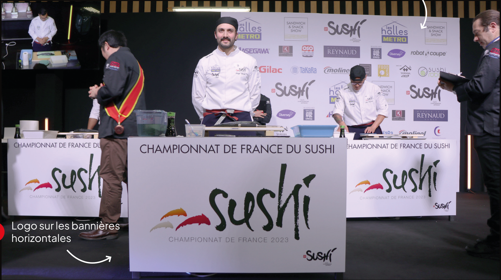
5 Logo sur les bannières horizontales